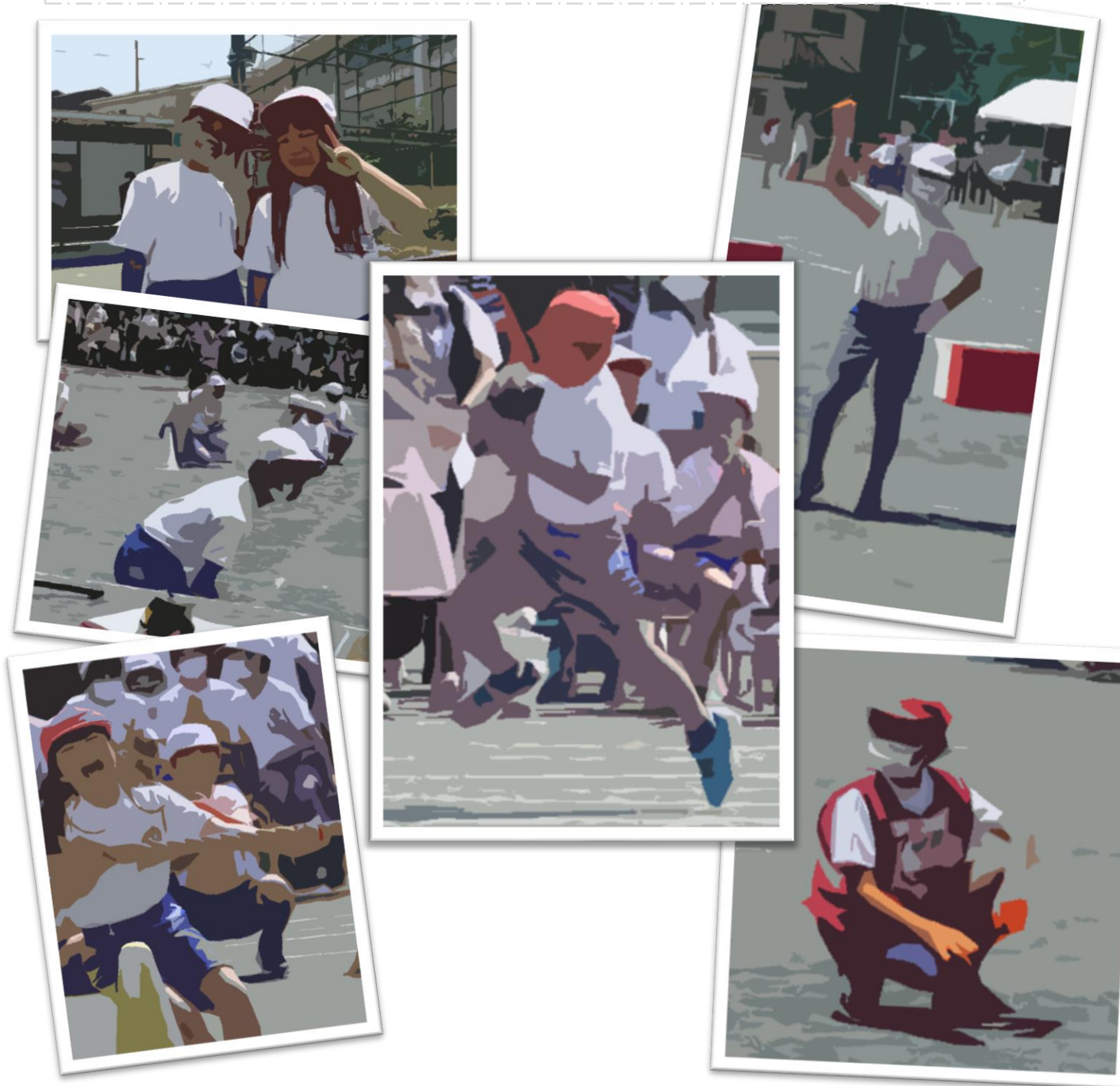
がむしゃらに頑張った運動会！！